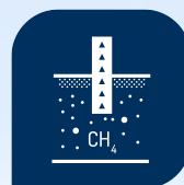
Extraction du méthane et recyclage