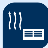
Systèmes de chauffage de l'air