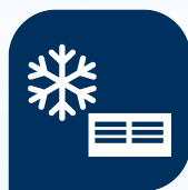
Охлаждение шахтного воздуха