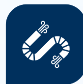
Гибкие и отсасывающие трубы

Подробную информацию Вы найдете на нашей веб-странице: www.cft-gmbh.de . Или просто позвоните к нам, мы с удовольствием ответим на все Ваши вопросы лично и подробно расскажем Вам о всех преимуществах новых сухих обеспыливателей.