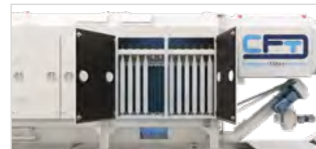
CFD mit Staubsammelbunker und Schneckenförderer