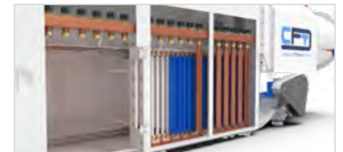
CFD mit Kettenkratzförderer